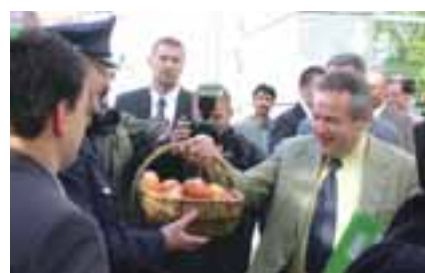
Beamte symbolisieren Thüringens Innenminister Andreas Trautvetter, dass sie „mehr wert sind als einen Apfel und ein Ei“.

Die DGB-Gewerkschaften befürchten, dass durch die Bundesratsinitiative zum Weihnachts- und Urlaubsgeld (Öffnungsklauseln) und den Austritt einzelner Länder aus der Tarifgemeinschaft „ein finanzpolitischer Flickenteppich“ entsteht. „Verlierer im Wettbewerbsföderalismus um die Fachkräfte werden die kleineren und finanzschwachen Länder sein“, prophezeit der DGB. Finanzschwache Länder würden die Sonderzuwen-