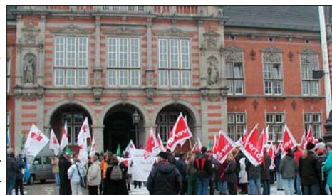
Warnstreik in Hamburg.

Die längere Arbeitszeit war auch eine der Hauptforderungen der Arbeitgeber bei den Tarifverhandlungen. ver.di hat sich mit dem Bund auf eine Wochenarbeitszeit von 39 Stunden verständigt. Beschäftigte im Westen arbeiten demnach 30 Minuten länger, während die Arbeitszeit