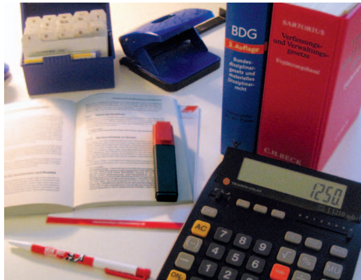
Dienstlichen Rechtsschutz gewähren auch die Gewerkschaften. Das DGB-Beamten-Info zeigt, wie.

In der Gewerkschaft Erziehung und Wissenschaft (GEW) wendet sich das Mitglied an die zuständige Landesrechtsstelle und stellt dort den entsprechenden Rechtsschutzantrag unter kurzer Darstellung des Sachverhaltes. Die in den Landesrechtsstellen tätigen Juristinnen und Juristen prü-