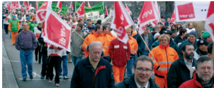
Beschäftigte des öffentlichen Dienstes demonstrieren in Heilbronn.