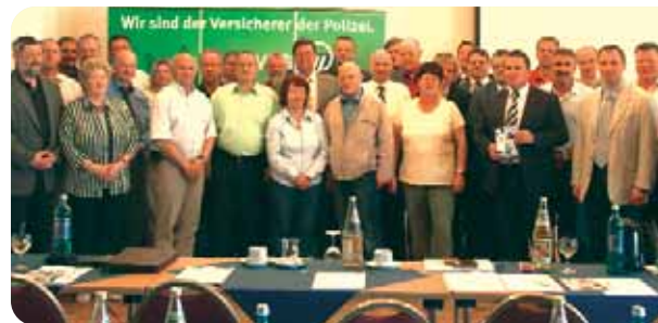
Personalvertreter/innen der GdP informieren sich über die Betreuungsmaßnahmen während des G8-Gipfels.

innen aus Bund und Ländern, um sich über den Vorbereitungsstand des Polizeieinsatzes und die gewerkschaftlichen Betreuungsmaßnahmen anlässlich des G8-Treffens zu informieren. Der GdP-Landesbezirk stellte das Betreuungskonzept vor. „Wir haben uns zum Ziel gesetzt, die Einsatzkräfte, soweit erforderlich, rund um die Uhr vor Ort zu unterstützen. Sieben mobile Betreuungsteams sollen in