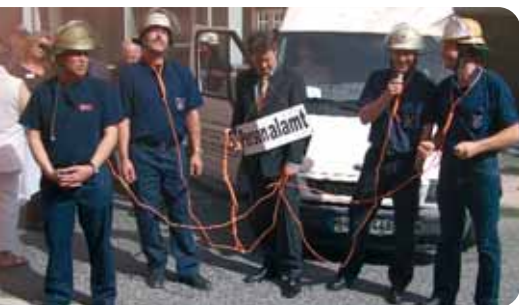
An die Leine gelegt: Hamburgs Feuerwehrbeamte protestieren gegen das neue Dienstmodell.

Ein breites Bündnis aus Berufsfeuerwehrlern und ihren Angehörigen, ver.di und Personalrat kämpft gegen das neue