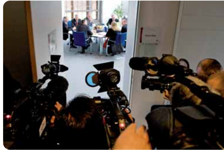
Im Blick der Medien: die Verhandlungsführer in der Tarifrunde.

Um keine Missverständnisse aufkommen zu lassen, verzichtete der Geschäftsführende DGB-Bundesvorstand auf Formulierungen wie „zeit- und inhaltsgleiche“ oder „wirkungsgleiche“ Übertragung des Tarifergebnisses. Die