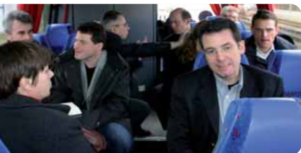
Der DGB mit Medienvertreter/innen auf Infotour zu ausgewählten Dienststellen in Baden-Württemberg.

Wird ein Feuerwehrmann mit 62 Jahren noch Menschen aus großer Höhe retten können? Soll ein Streifenpolizist bei der Leistungsbezahlung leer ausgehen, weil sein Kollege den Fall aufgenommen hat? Über solche strittigen Fragen der geplanten Dienstrechtsreform in Baden-