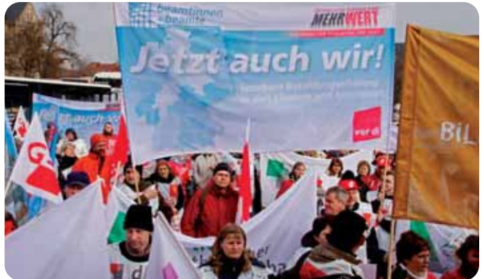
5.000 Streikende waren am 26. Februar auf den Erfurter Domplatz gekommen. Unter ihnen auch viele Beamtinnen und Beamte.

Besonders kritisch werden die Beamtinnen und Beamten der Gemeinden auf die Übertragung schauen. Sie konnten nicht vom Tarifabschluss mit Bund und Kommunen profitieren und erhalten erst jetzt die überfällige Anpassung. Auch hier gilt: Wird das Tarifergebnis übertragen, rückt die Besoldung in diesem Jahr dicht an das Niveau auf Bundesebene heran und überschreitet es im kommenden Jahr. 11,80 Euro betrüge der Rückstand auf die Bundestabellen am Beispiel Nordrhein-Westfalens. Ab März 2010 wären es sogar zwischen 7,46 und 58,42 Euro mehr.